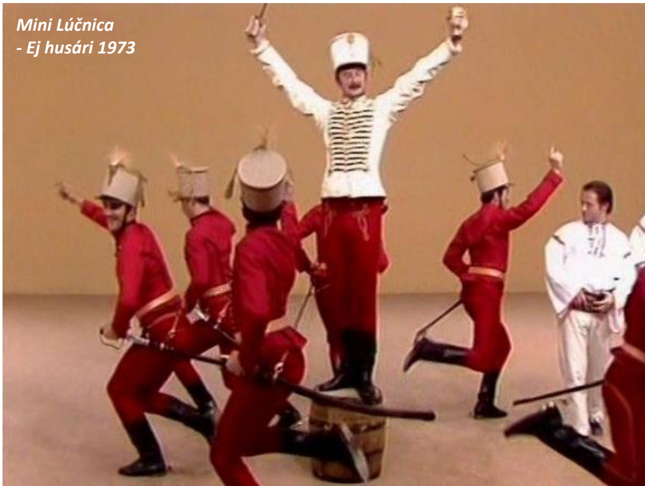
Mini Lúčnica - Ej husári 1973