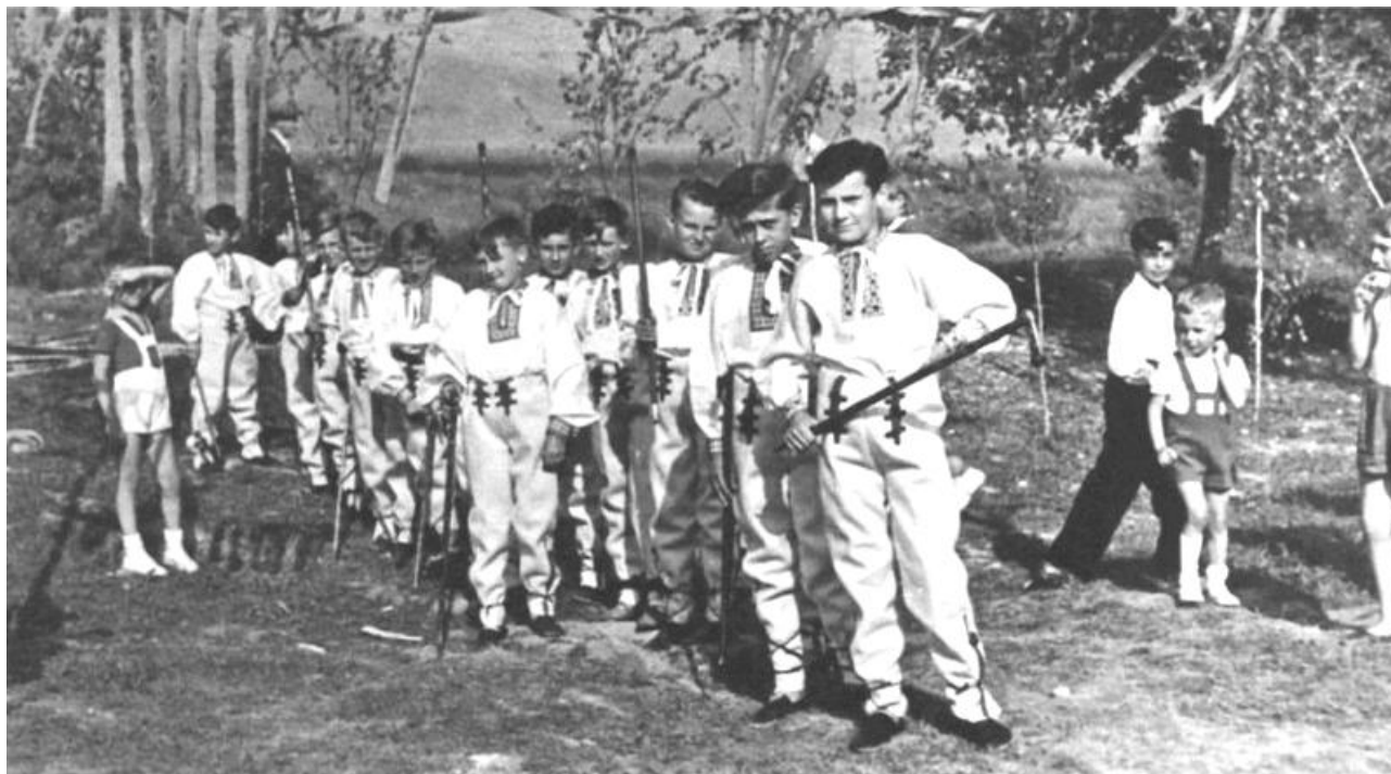
Butor v školskom fs pri OSŠ kokava v roku 1952 - štvrtý v popredí