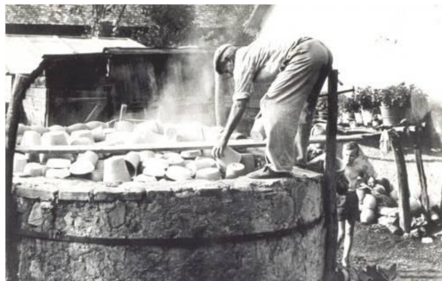
Vypaľovanie hrnčiarских výrobkov v Haliči.

Výroba predmetov z hliny je jedným z najstarších remesiel. V Novohrade existovalo ešte na začiatku 20. storočia viac ako 40 hrnčiarских stredísk. Najvýznamnejšou hrnčiarskou lokalitou bola Halič . Všetky výrobky boli ručne vytáčané na kruhu, hrnčiari nepoužívali formy. Vyrábali rôzne druhy krčahov a vyšších nádob, ktorých priemerná výška sa pohybovala od 18 do 33 cm. Bohatá bola aj produkcia „nízkeho riadu“: rôzne druhy tanierov, misiek, pokrievky na hrnce, ťapše, formy na koláče, lievance, bábovky a cedidlá na cestoviny.