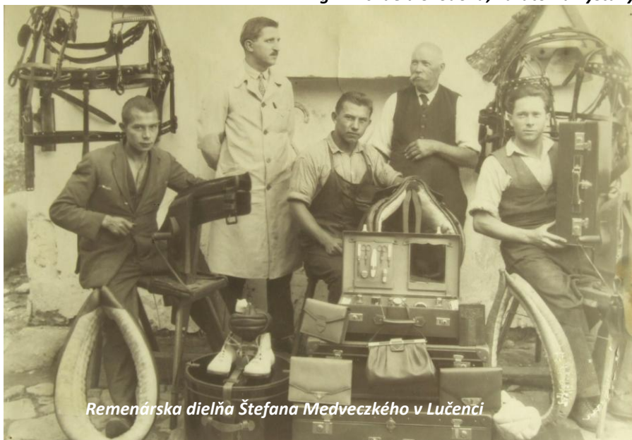
Remenárska dielňa Štefana Medveczkého v Lučenci