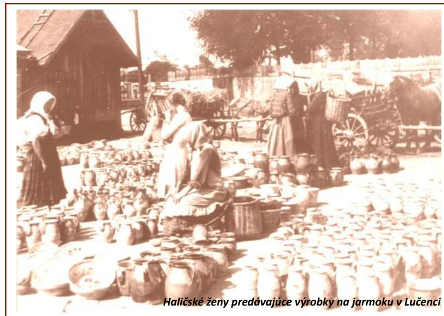
Haličské ženy predávajúce výrobky na jarmoku v Lučenci

3. – 31. augusta 2012 Dom kultúry – Kokava nad Rimavicou