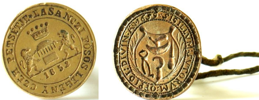
Pečatidlo cechu hrebenárov

Väčšina cechov v Novohrade vznikla koncom 18. a začiatkom 19. storočia, čo však neznamená, že tu ešte pred týmto obdobím nepôsobili žiadni remeselníci. Cechy vznikali a vyvíjali sa v novohradských mestečkách Lučenec, Filakovo, v Balašských Ďarmotách a na hradných panstvách v Haliči a v Divíne , a to so súhlasom zemepána.