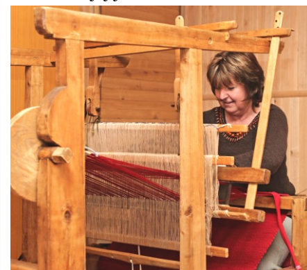
Pokračovanie na s. 4

podarilo projektom „Folklórne parádnice“. Je to netradičná prezentácia tkáčskeho remesla formou detskej módnjej prehliadky, v ručne tkaných nadčasových odevoch je zatkávaný ručne pradený ľan a vytkané vzory sú vzory, ktoré zdobili v minulosti odevy v našom regióne. Moje tkané ľanové výrobky získali certifikát Regionálneho produktu Gemer-Malohont. Svoje skúsenosti s tradičným tkáčskym remeslom odovzdávam ďalej ako lektorka tkania na rôznych kultúrnych podujatiach. Spolupracujem s kultúrnymi inštitúciami, občianskymi združeniami – ÚĽUV Bratislava, Gemersko-malohontské osvetové stredisko v Rimavskej Sobote, OOCR Novohrad a Podpoľanie, Novohradské osvetové stredisko v Lučenci, MAS Malohont a mnohé iné, ktoré sa venujú tradičným remeslám. V r. 2020 som spolu so skupinou remeselníkov a dobrovoľníkov založila občianske združenie „Čarovná nitka“ v Kokave nad Rimavicou. Náplňou činnosti nášho združenia je spoznávanie histórie tradičných remesiel, osvojovanie si remesiel a ich následné predvádzanie širokej verejnosti. Od novembra 2023 sme v Kokave nad Rimavicou pre verejnosť sprístupnili „Dom tradičného ľudového tkania“ so stálou expozíciou „Od ľanu po plátno“. Expozícia je názornou ukážkou postupnosti ručného spracovania ľanu priadneho, od jeho zasatia, rastu, ručného spracovania až po zatkanie a vytvorenie hotového výrobku. Expozícia je doplnená o komentovanú prehliadku členkami občianskeho združenia, ktoré sa venujeme pestovaniu ľanu, čím získala na svojej jedinečnosti.